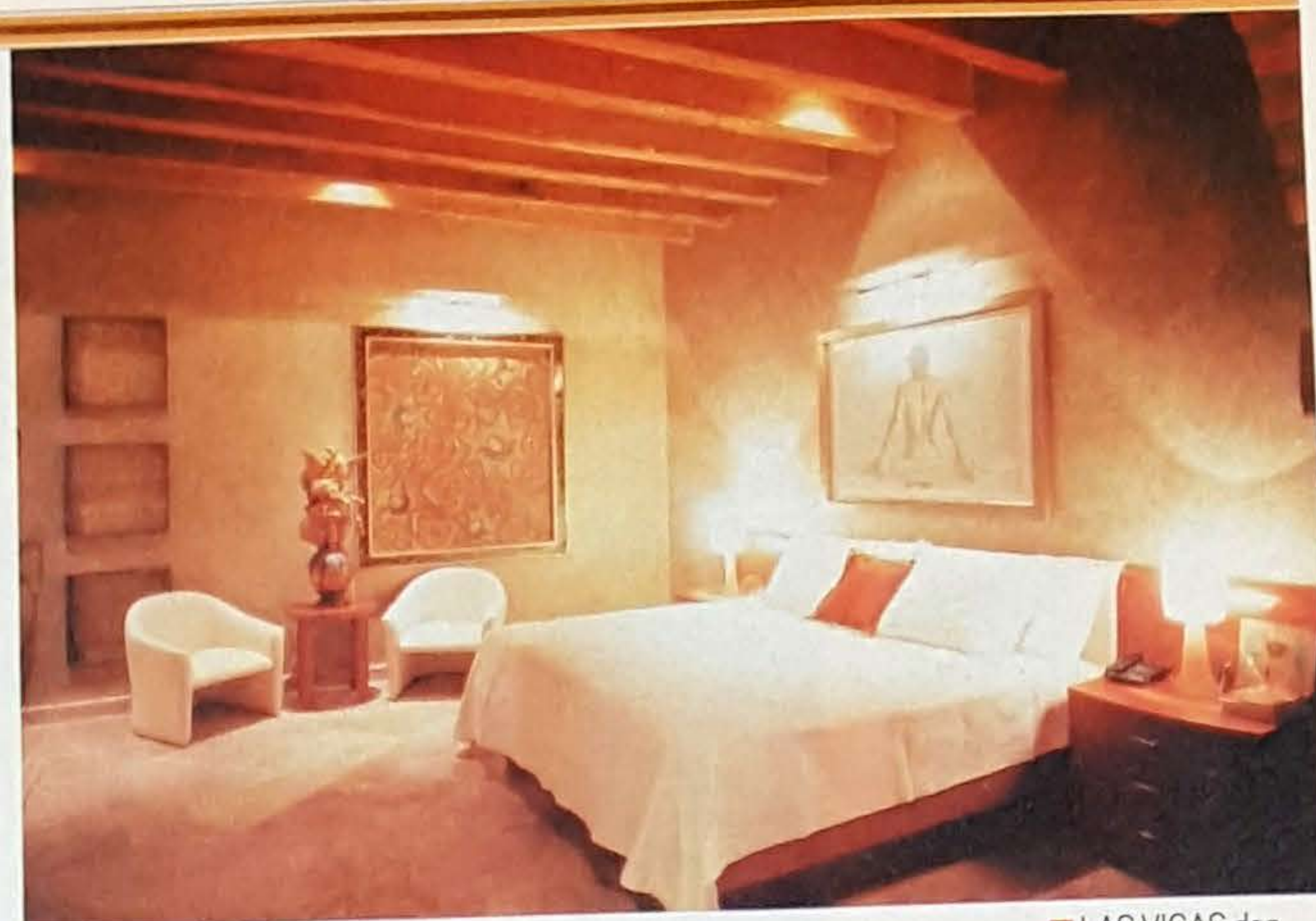
■ LAS VIGAS dan un aspecto señorial a las habitaciones.

El aprovechamiento de la luz natural es un elemento básico. La bóveda es el elemento arquitectónico principal, sólo unas vigas sostienen los techos de cristal esmerilado, dotando de luz todo el espacio. Los baños y vestidores tienen cubos de luz, por lo que sólo se requiere de iluminación artificial de noche.