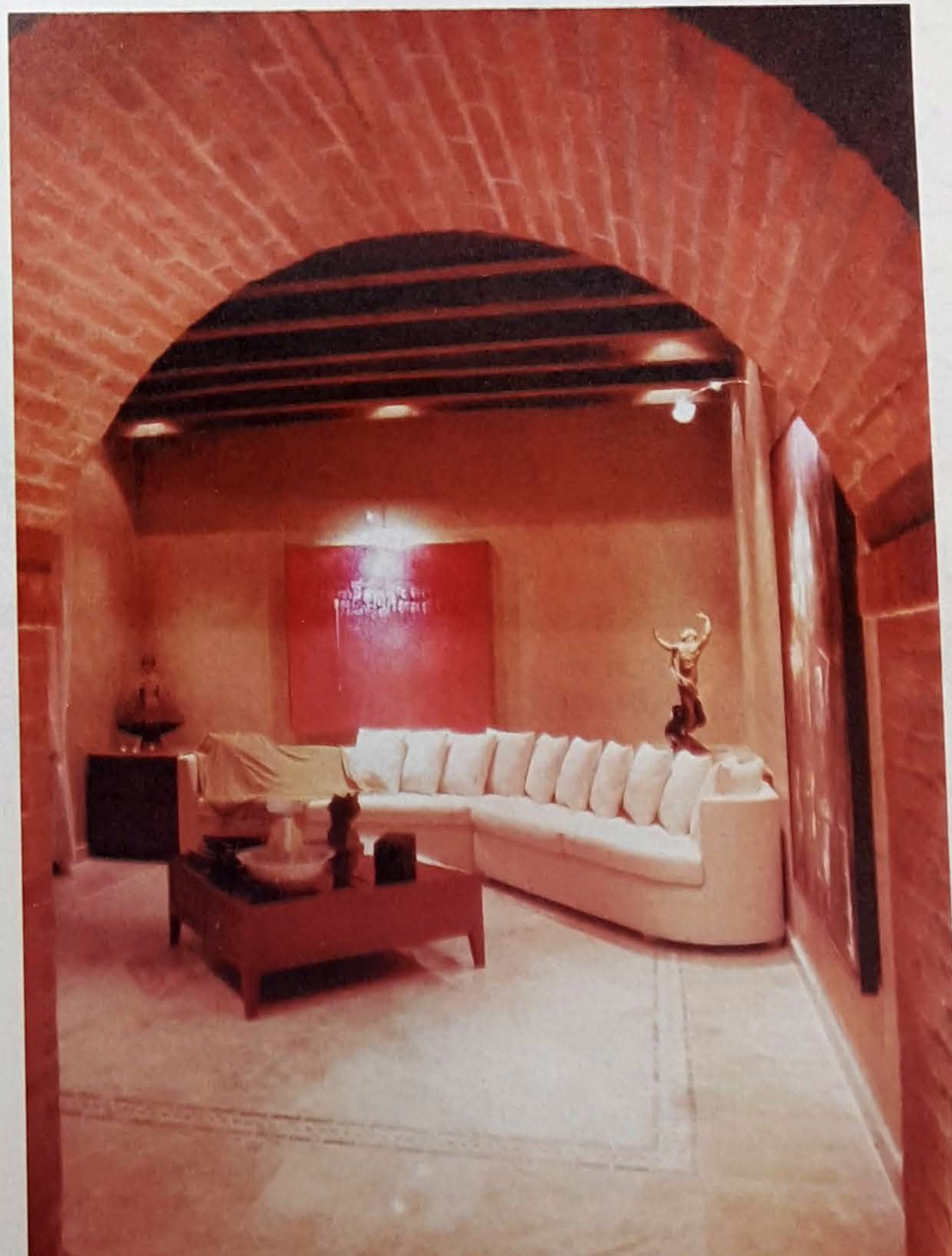
■ SE CONJUGA ARQUITECTURA, mobiliario y arte.