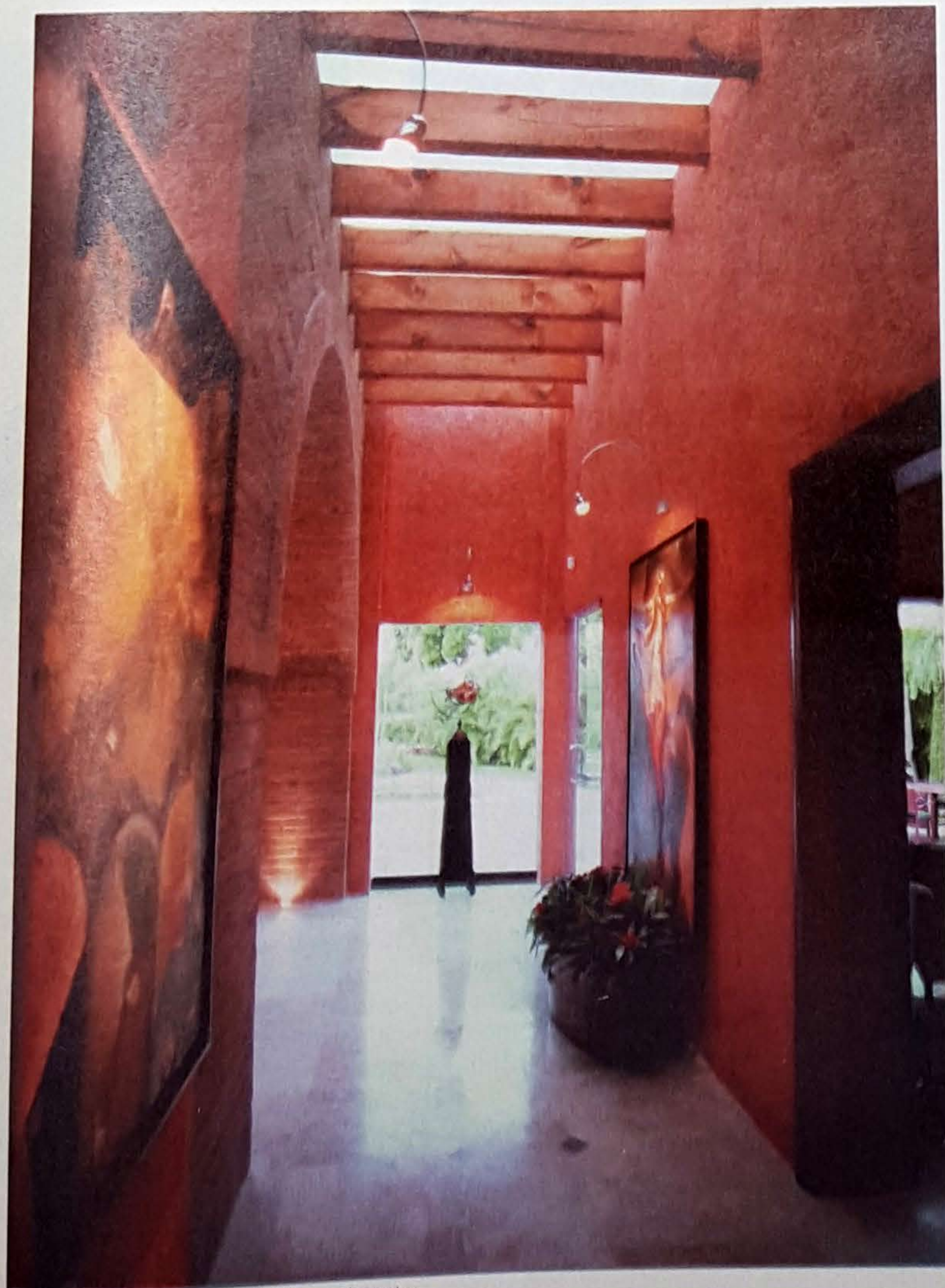
■ HAY UNA RELACIÓN CONTÍNUA con el exterior.

"Por otro lado, el mobiliario fue considerado en general con un sentido, en relación a la necesidad de poco mantenimiento, comodidad y belleza, y acorde con un estilo mexicano contemporáneo. En los acabados no existe una sola pieza de material artificial, lo que le da una calidez a la casa que los visitantes perciben haciendo que se sientan relajados y a gusto", puntualiza Ruiz Falcón.