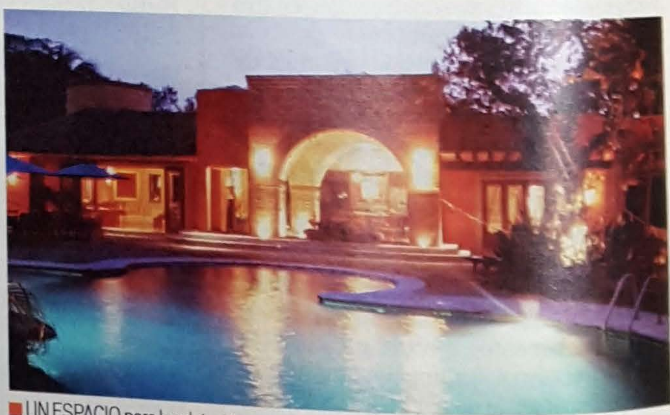
■ UN ESPACIO para la relajación en un entorno natural.

Este proyecto se comenzó de afuera hacia adentro, agrega, por lo que primero se construyó el área de la terraza que da al río y la alberca.